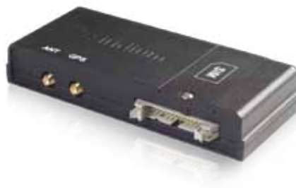
Приёмопередающая установка Иридиум 9522В по передаче голосовых и цифровых данных