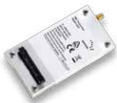
Модем Иридиума 9601 SBD

Современные критически важные приложения от компании Иридиум тщательно испытаны в самых суровых условиях, известных человеку – от студенной Арктики до экваториальных пустынь, от летящих высоко в небе самолетов до роботизированных подводных планеров.